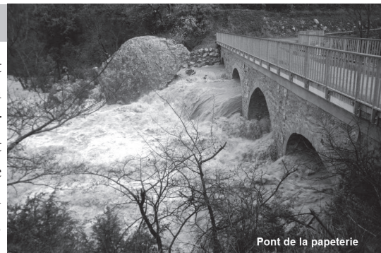
Pont de la papeterie