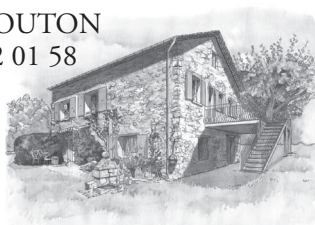
Illustration : Bernard Nicolas