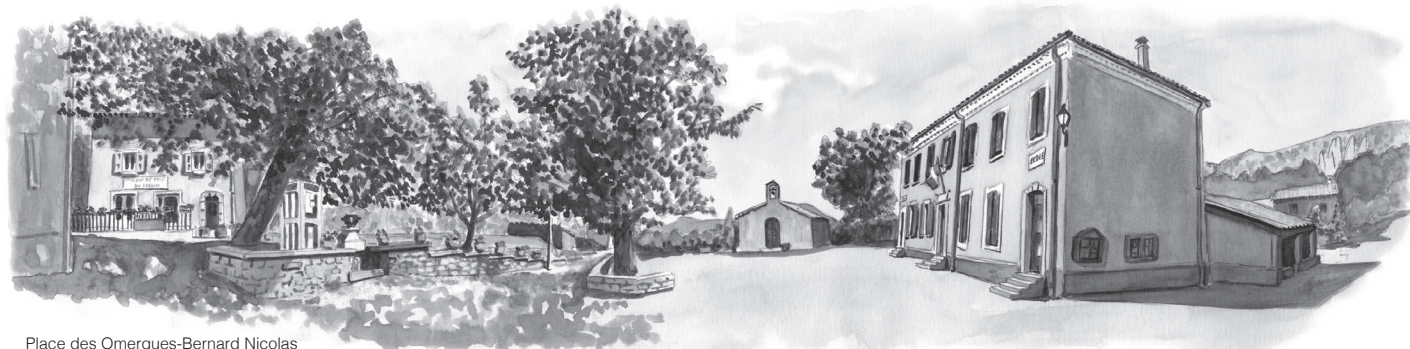
Place des Omergues-Bernard Nicolas