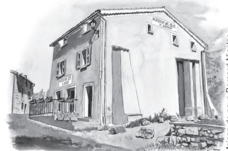
Maison de pays-Bernard Nicolas