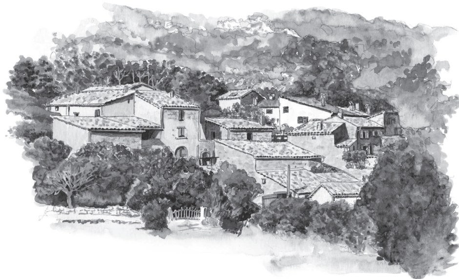
Les étangs-Bernard Nicolas