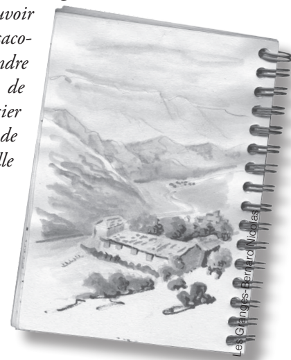
Les Granges - Bernard Nicolas

Bouboule : "Du haut de mes 30 ans et en tant que doyen de la cavalerie, j'ose clamer haut et fort que les habitants des Granges, ce sera avant tout nous, Étoile ma fiancée, Naya la doudou, Tennessee l'éclopé, Suria la douce, Vasco le trotteur, et toutes les abeilles que je ne nommerai pas. Bien sûr, je n'oublie pas Goliath le vieux chien qui préfère dormir plutôt que de nous accompagner dans les montagnes. Tous nous allons, enfin, pouvoir poser nos sacs et prendre le temps de nous rassasier à l'herbe de cette belle vallée."