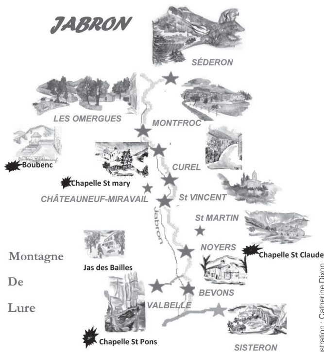
Illustration : Catherine Dixon