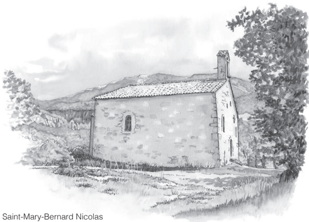
église Saint-Mary-Bernard Nicolas

9h30 : messe à l'église Saint-Mary de Châteauneuf-Miravail