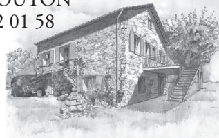
Illustration : Bernard Nicolas