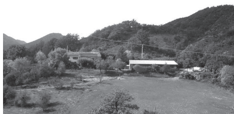
Les Costoliers