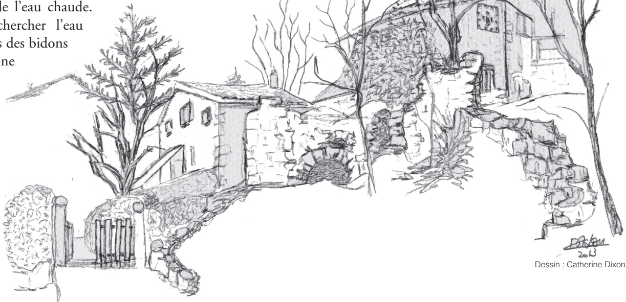
Dessin : Catherine Dixon

On allait chercher l'eau potable dans des bidons à la fontaine au bord de la route un peu plus haut.