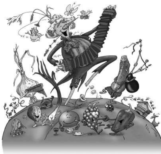
illustration : Bernard Nicolas - www.danselombre.com

Tressage d'un plessis en osier à partir de 14 h