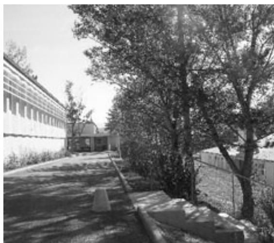
Photo du site de l'académie