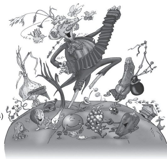
illustration : Bernard Nicolas - www.danselombre.com

Diaporama des activités de l'ébauchoir (stages - expérimentation de fours - recherche avec les géologues)