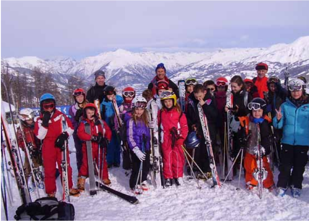
3 sorties de ski en Ubaye : l'école de Bevons à Pra-Loup !