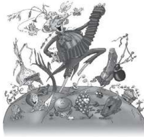
Illustration: Bernard Nicolas - www.danselombre.com

Compagnie du FOL ESPOIR : déambulations et spectacle en extérieur près des artisans le samedi et le dimanche après midi